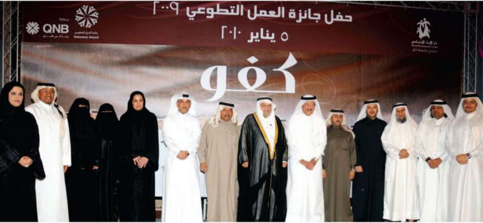
جائزة QNB للعمل التطوعي

يشكل الدعم الذي تقدمه مجموعة QNB في المجالين الإنساني والاجتماعي أحد أهم أركان مسؤولياتها الاجتماعية. وسواء كان هذا الدعم متمثلاً في الأنشطة التي يقيمها البنك على المستوى المحلي لدعم الأيتام والفئات الأقل حظاً أو من خلال إرسال المساعدات الدولية إلى ضحايا الكوارث الطبيعية حول العالم، يركز هذا الجزء من برنامج مجموعة QNB للمسؤولية الاجتماعية على التوزيع العادل للثروة.