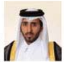
سعادة الشيخ جاسم بن عبد العزيز بن جاسم بن حمد آل ثاني عضو اللجنة التنفيذية عضو منذ عام ٢٠٠٤