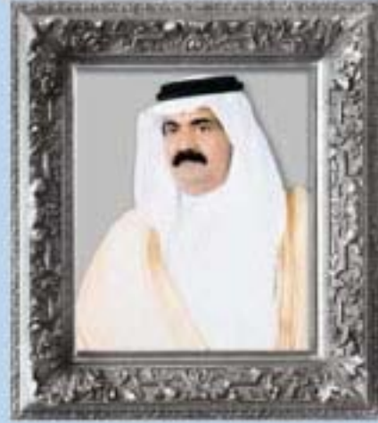
حضرة صاحب السمو الشيخ حمد بن خليفة آل ثاني أمير دولة قطر