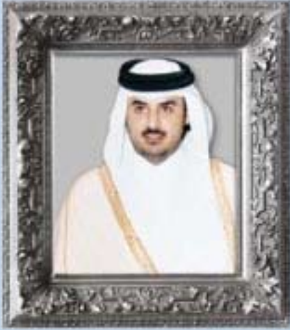
سمو الشيخ تميم بن حمد آل ثاني ولي العهد