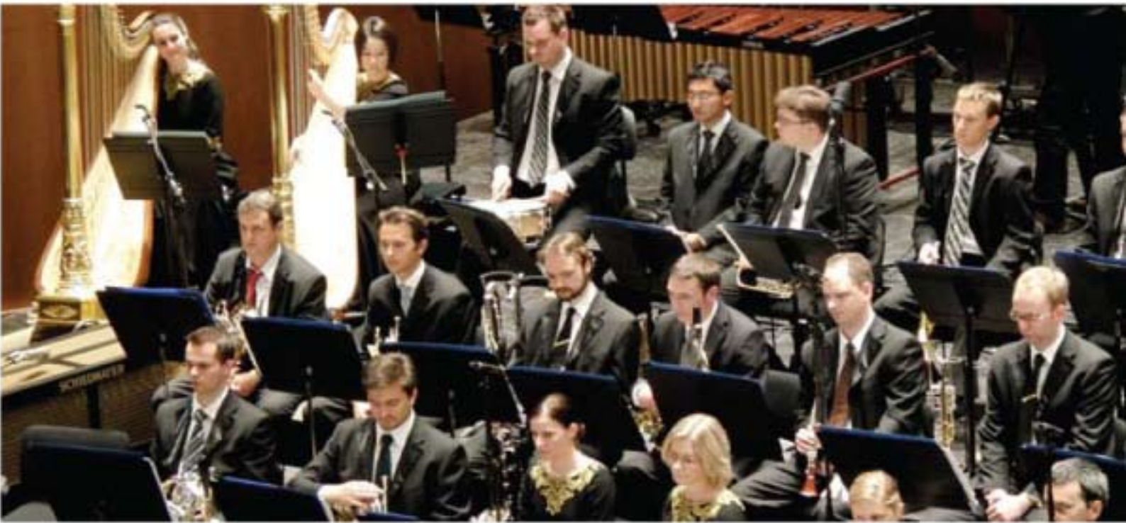
حفل موسيقي في باريس

في الوقت الذي توسّع فيه مجموعة QNB حضورها على الساحة الدولية، يلتزم البنك بالمساهمة في نشر الوعي حول العالم العربي وثقافته في شتى أنحاء العالم. فبمنذ عام ٢٠٠٠، قام البنك بدعم مجموعة واسعة من الأنشطة للتعريف بالثقافة وأسلوب الحياة العربية. ومن خلال مشاركة آراء وقيم الشعب القطري مع المقيمين داخل قطر والجماهير في الخارج، يساهم البنك في تعزيز التواصل الثنائي الذي يدعو إلى التعايش السلمي والذي بدوره يدعم الازدهار والتنمية.