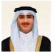
سعادة الشيخ حمد بن عبدالله بن خليفة آل ثاني عضو منذ عام ٢٠٠٧