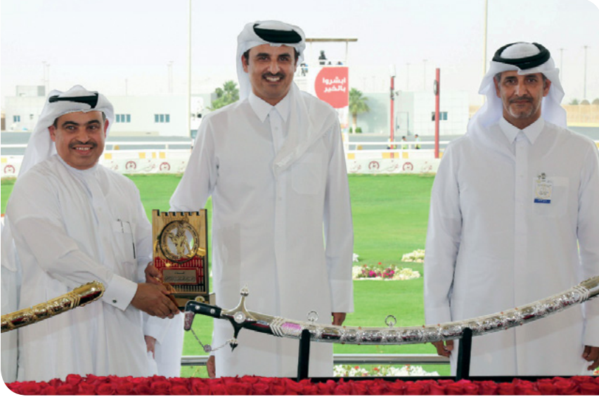
أعلاه: رعاية مهرجان سباق الهجن العربية الأصيلة على سيف صاحب السمو أمير البلاد المفدى.

"على مر السنين، شارك المتطوعون من البنك في دعم مجموعة واسعة من المشاريع والمبادرات الاجتماعية، بما في ذلك أنشطة جمع التبرعات وحملات النظافة ومبادرات التربية المالية وتدريب الفرق الرياضية للأطفال وحتى توفير وجبات دافئة للمحتاجين."